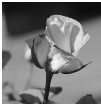
Blütenpracht im Garten

Nach dem fabelhaften 5-Gang-Menü jurierten wir die Bilder zum Thema Menschen, welche im Vorfeld der Fototage von den Teilnehmern eingesandt werden mussten. Antonino Catalano aus Brig erreichte – notabene mit einem Bild, welches er im Tessin aufgenommen hat – den ersten Rang. Anschliessend liessen wir den Abend gemütlich auf der Terrasse ausklingen.